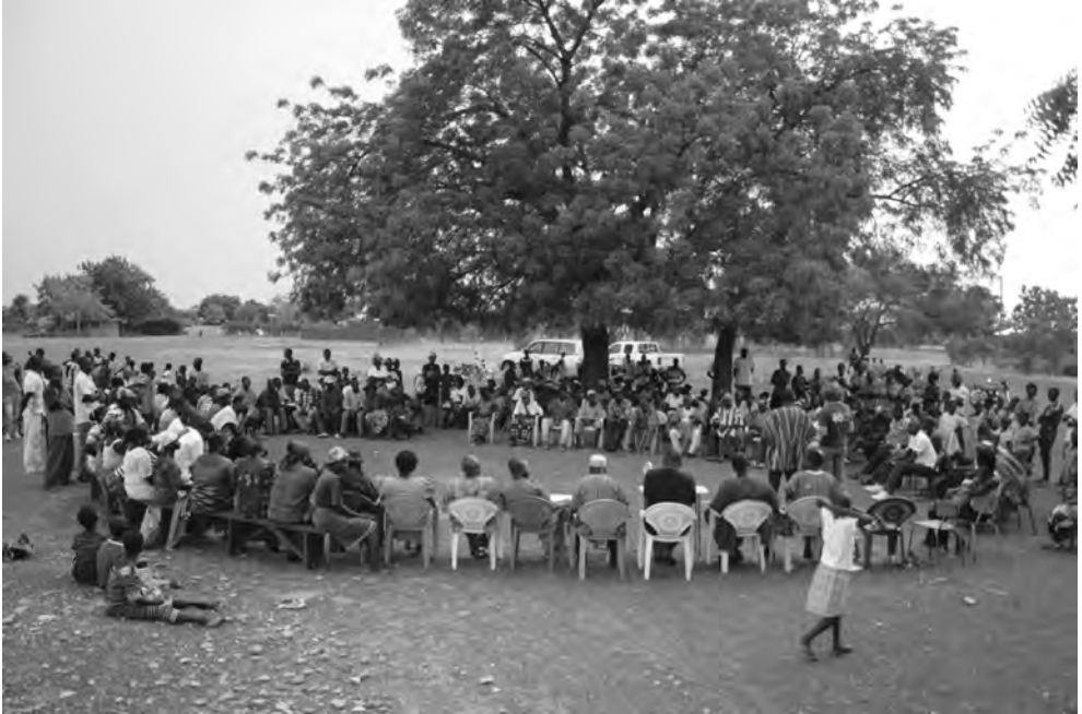
Reunión de la comunidad de Tanchara para discutir la minería de oro y el PCB.