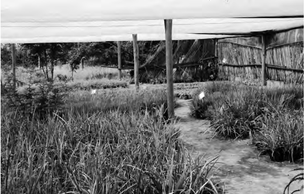
Vivero de plantas medicinales cuidadas por miembros kukulas.

Las comunidades de Bushbuckridge viven en la región sur de la Biósfera K2C en la Provincia de Mpumalanga. La municipalidad de Bushbuckridge está delimitada por el camino Orpen hasta el Parque Nacional Kruger al norte, el Río Sabie al sur, el acantilado Drakensberg al oeste y los límites del extremo más occidental de KNP, y al este la Reserva de Caza Sabie-Sand. Si bien una gran parte de esta área es administrada por el gobierno, la mayoría es tierra de pastoreo de la comunidad.