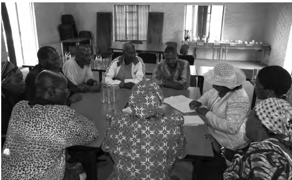
El grupo de facilitación redactando un código de ética para complementar el PCB.

directivo de 26 personas, siendo seis de ellos integrantes del comité ejecutivo, elegidos anualmente por todos los miembros de la asociación. El comité ejecutivo apoya a la asociación para que se vincule con otras partes interesadas en K2C, incluyendo actores comerciales y del gobierno para coordinar el desarrollo y uso del PCB.