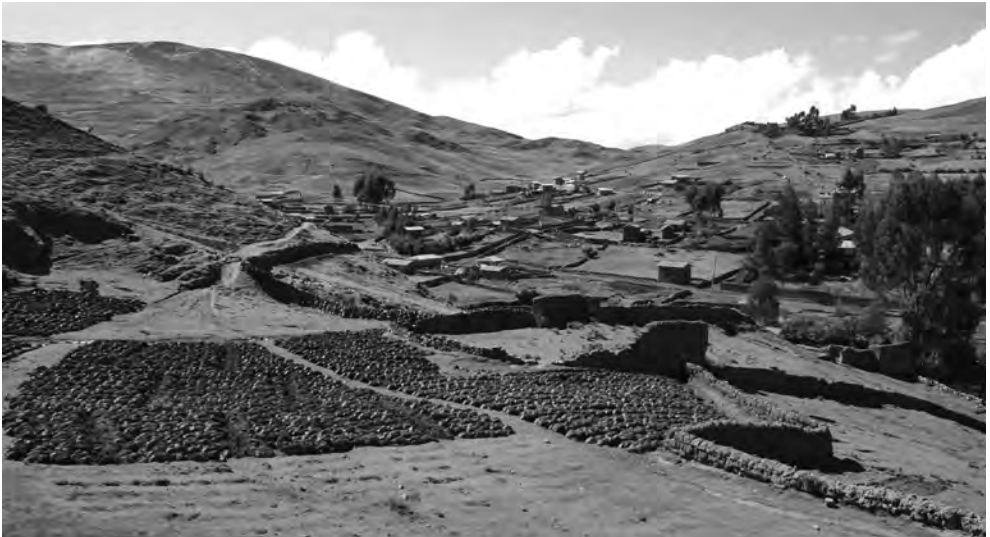
Paisaje panorámico. Parque de la Papa, Písaq, Perú.

conocimiento tradicional (CT) y los conceptos y enfoques indígenas.