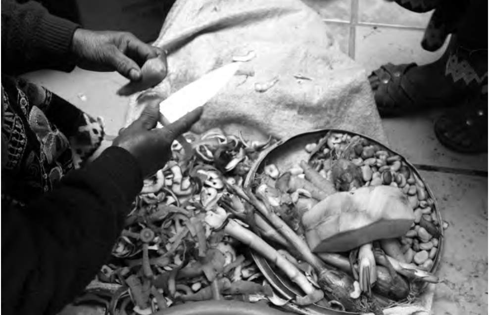
El colectivo de mujeres que administra y opera el pequeño restaurante proporciona demostraciones de cocina y comidas para mostrar los ingredientes locales tradicionales, como la quinoa y el amaranto.

ismo y otros servicios relacionados (por ejemplo, restaurante e instalaciones de alojamiento);