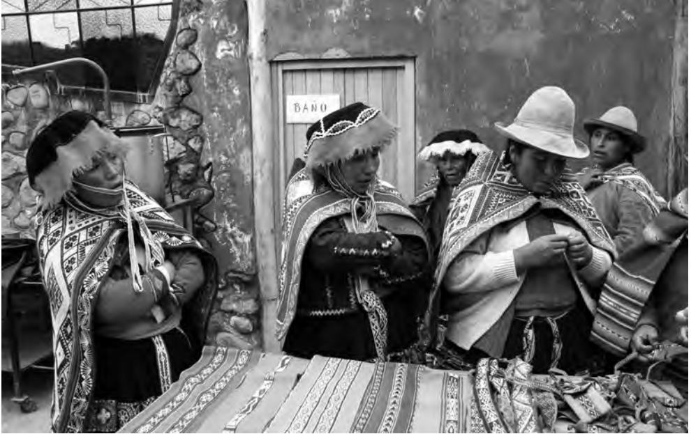
Un colectivo de mujeres produciendo artesanía hecha con materiales locales y vendiéndola en el Centro de Interpretación.