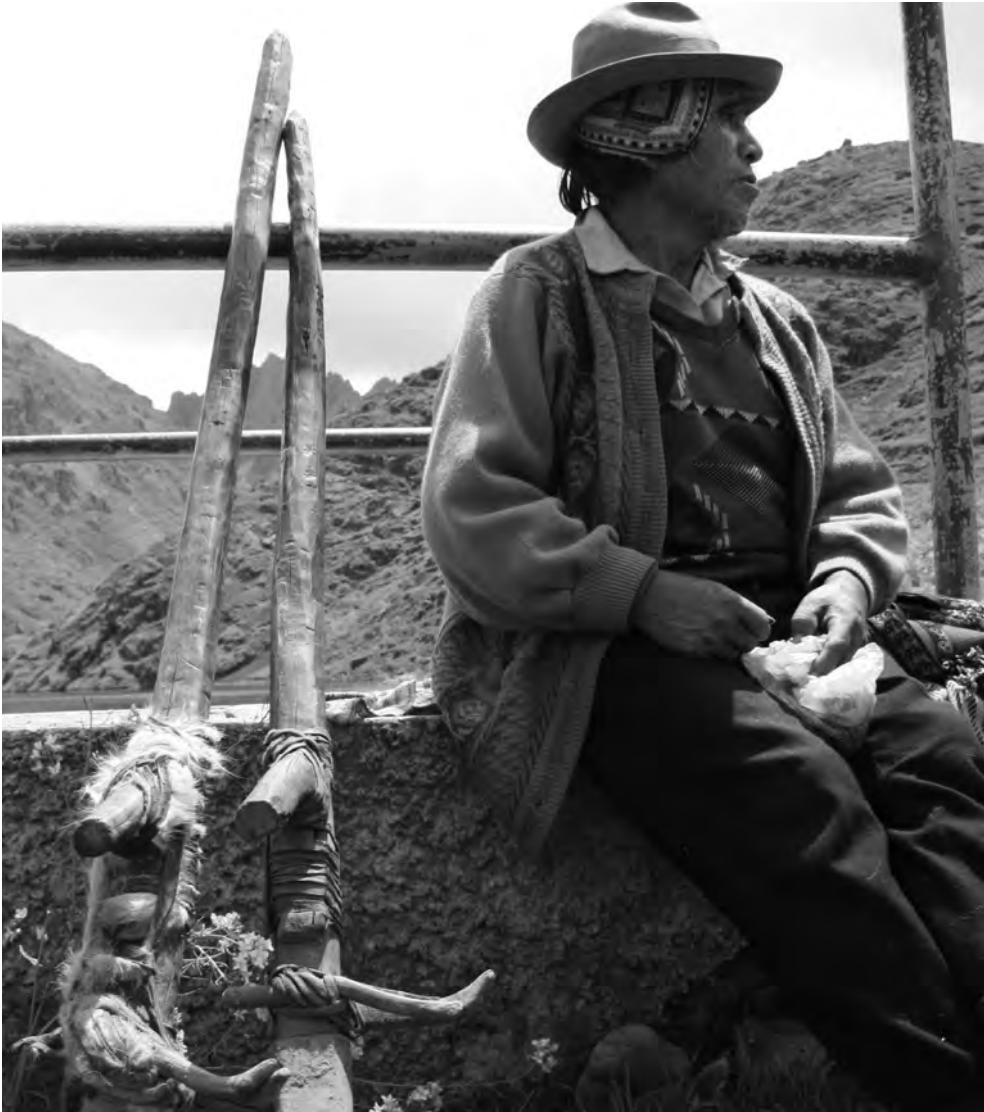
Agricultor andino tradicional, Parque de la Papa, Písaq, Perú.