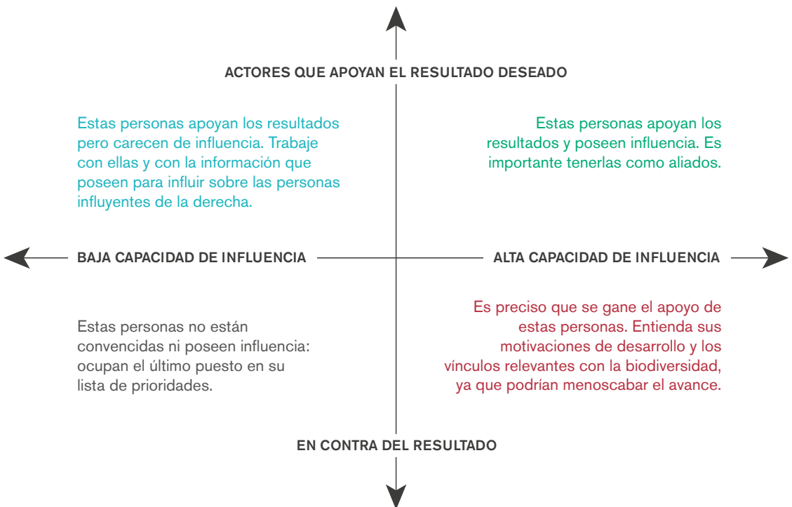
Esquema 3: matriz simple para identificar a los actores clave

Intente trabajar sobre todo con los actores que tengan mayor influencia, ya sea esta positiva o negativa. Los poderes políticos o económicos pueden influir sobre la atención y el presupuesto que se asigne a la biodiversidad. Pero los poderes de influencia también podrían ser científicos, tradicionales o de conocimiento práctico. La biodiversidad puede ser también una fuente importante de riqueza tanto nacional como local. Pueden existir cuestiones de corrupción y de especulación con respecto a esta riqueza: es importante que esté informado.