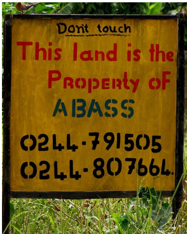
Un fermier défendant sa propriété avec ce signe expédient ! (Accra, Le Ghana Peri-urbains)

application. En dehors des quelques programmes officiels décrits ci-dessous, les gens sont constamment à la recherche de moyens d'améliorer leur sécurité foncière.