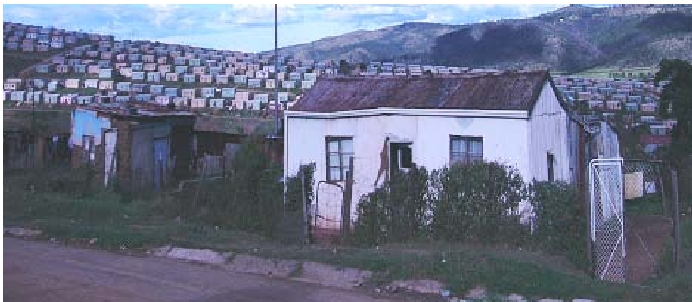
Bas arrangement dense de logement de revenu dans les périphéries du Cap (village de Fingo, le Cap, Afrique du sud)